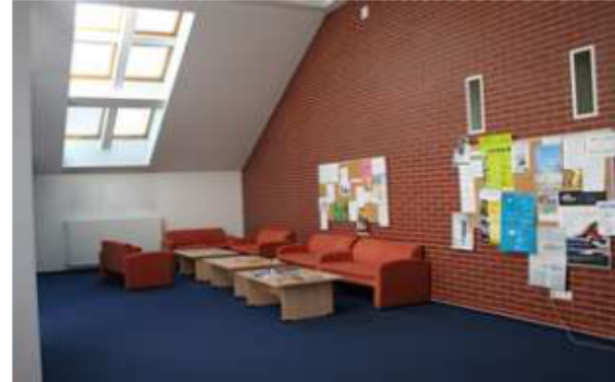
Aufenthaltsräume an der Andrassy im Stadtteil Pest